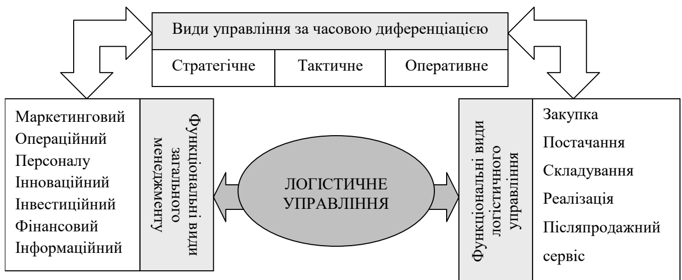
Рис. 1. Місце логістичного управління в системі загального менеджменту підприємства

Логістичне управління є визначальною складовою загального менеджменту підприємств. Воно передбачає досягнення стратегічних і тактичних цілей (рис.1).