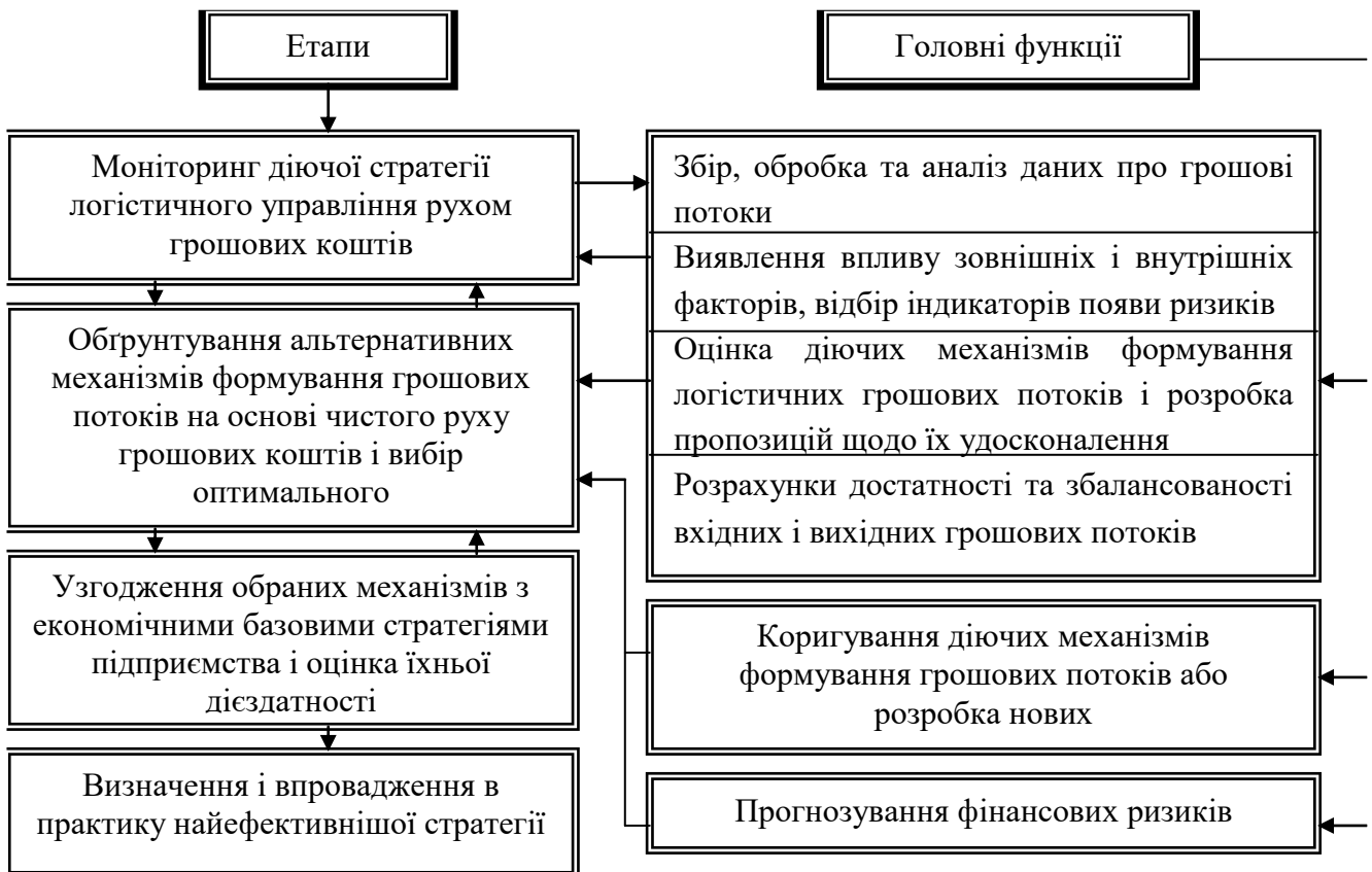
Рис. 2. Схема розробки стратегії логістичного управління грошовими потоками підприємств

використовуватися при прийнятті управлінських рішень, орієнтованих на досягнення стратегічних цілей.