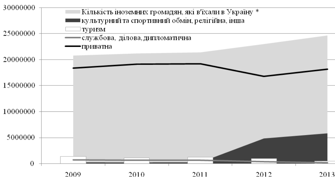
Рис. 2. Динаміка в'їзного потоку іноземних громадян в Україну

Станом на 1 жовтня 2013 р. на обліку в районних податкових інспекціях Головного управління Міндоходів у Києві перебували 273 платники турзбору, з яких 166 – юридичні особи, 107 – особи [5].