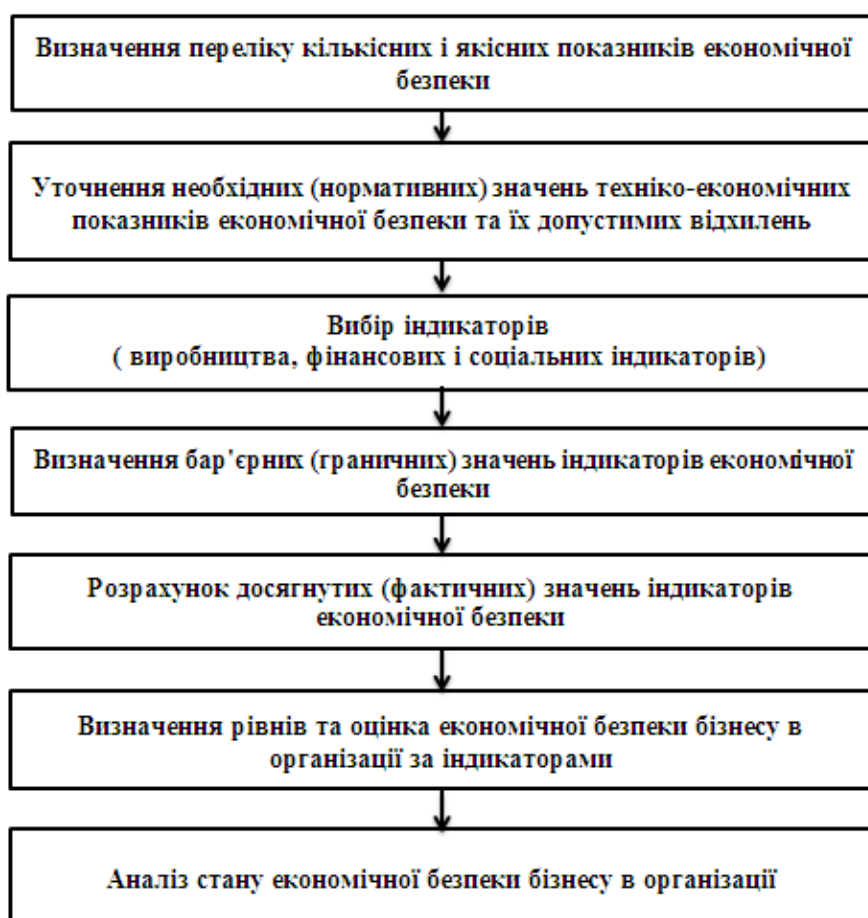
Рис.2. Схема застосування індикаторного методу при оцінці економічної безпеки бізнесу в організації.

Для оцінки поточного рівня економічної безпеки організації у відповідності зі схемою (див. рис.2) застосовують основні показники [7,13] , що характеризують результати діяльності: фінансово-економічну стійкість, стабільність і безперервність виробничої діяльності, ефективність використання ресурсів.