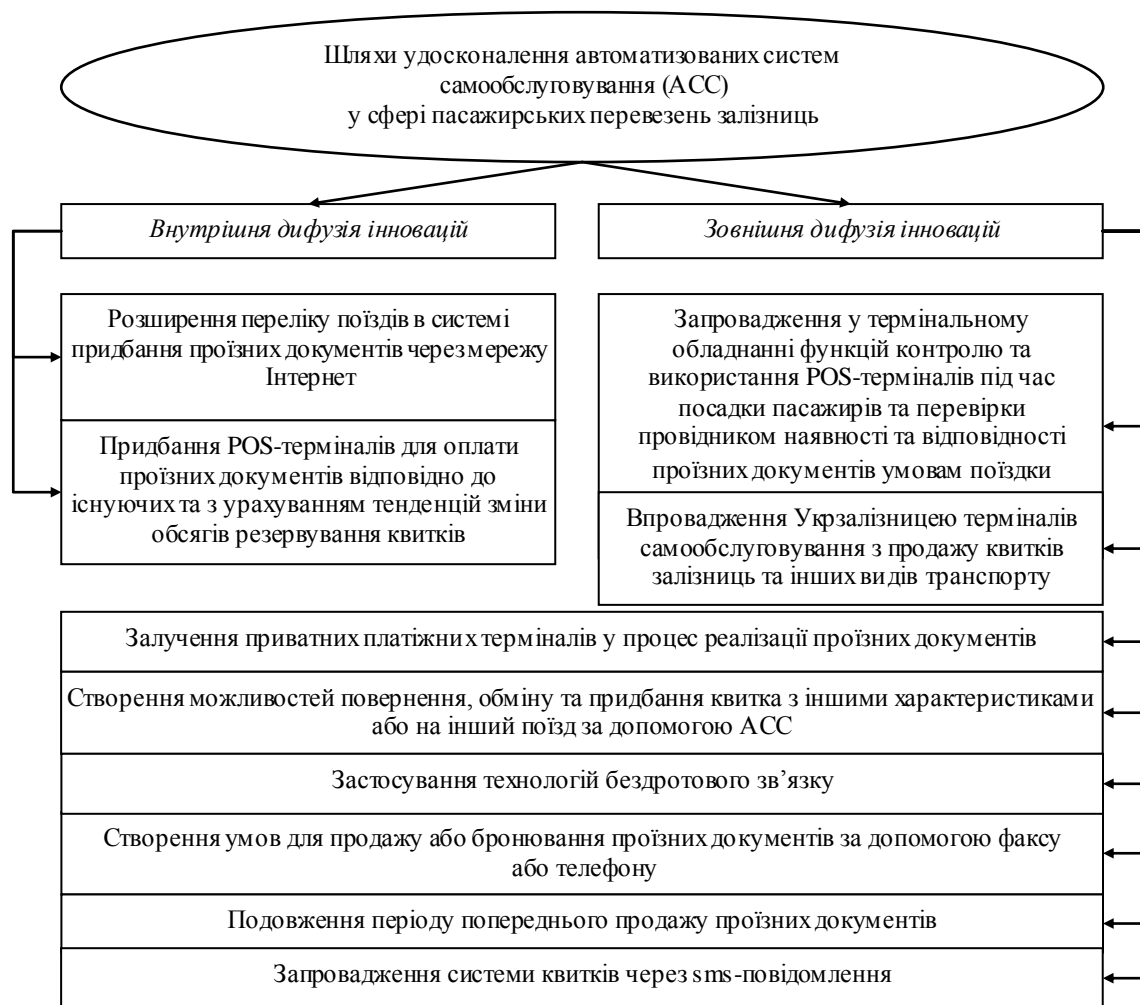
Рис. 3. Головні шляхи удосконалення автоматизованих систем самообслуговування (АСС) в сфері пасажирських перевезень залізниць

Висновки. Підсумовуючи результати дослідження слід підкреслити, що в сучасних умовах ІТ починають широко розвиватись і впроваджуватись в систему транспортного обслуговування населення. Після огляду засобів збуту залізничних квитків в деяких країнах Європи, можна зробити висновок, що зважаючи на значні кроки у напрямі запровадження ІТ у сфері пасажирських перевезень, урахуваючи здобуті досягнення щодо автоматизації процесів управління перевезеннями та обслуговування пасажирів, існуюча в Україні система реалізації проїзних документів потребує подальших змін.