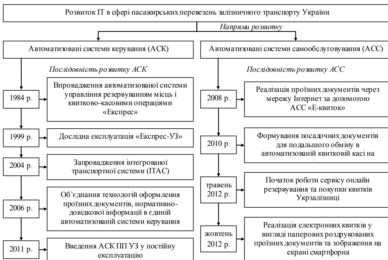
Рис. 1. Напрями та хронологія розвитку ІТ в сфері пасажирських перевезень залізничного транспорту України.

Хронологію розвитку ІТ в сфері пасажирських перевезень залізничного транспорту України представлено на рис. 1.