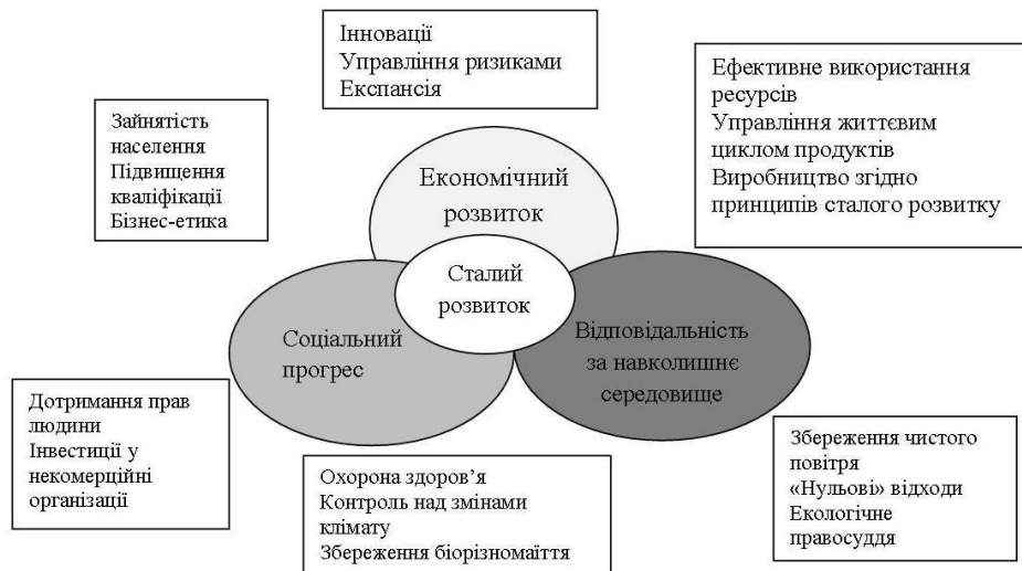
Рис. 2. Сталий розвиток підприємства

Проведені дослідження розвитку концепції сталого розвитку у світі дозволили встановити, що на сьогодні існує певна теоретична, практична та правова база її розвитку та впровадження в діяльність підприємств, зокрема, телекомунікаційних. Так, Організація Об'єднаних Націй створила «Глобальний договір ООН», в якому концепція сталого розвитку (у поєднанні із розвитком питання щодо соціальної відповідальності бізнесу) визнана по всьому світі в якості бажаної.