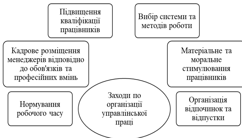
Рис. 1. Заходи по організації управлінської праці на підприємстві

Резерви часу менеджера є обмеженими, тому виникає питання про його раціональне використання й економію, адже від цього залежить успіх кожного працівника. Для вирішення такого завдання треба знати, на що витрачається час, на що його треба витратити і як це робити раціональніше [2]. Для того щоб кожен працівник ефективно працював необхідно втілювати ряд заходів по організації управлінської праці на підприємстві (рис. 1).