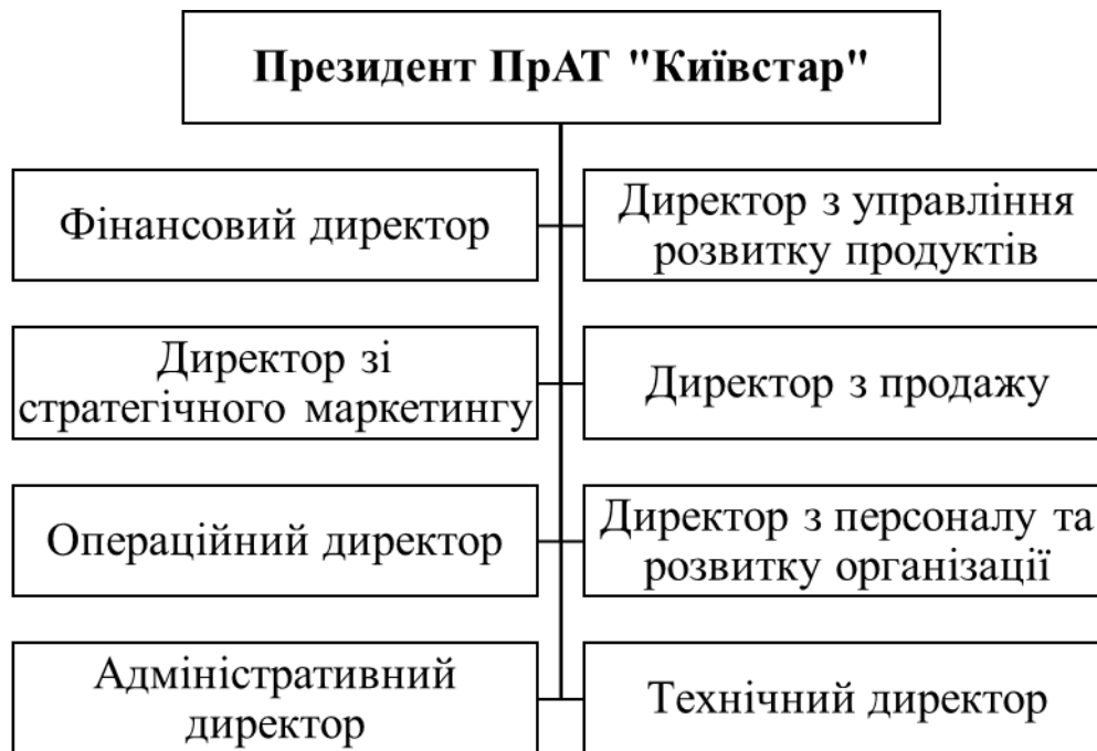
Рис. 1. Організаційна структура ПрАТ «Київстар»

Функціональні обов'язки, пов'язані з управлінням інноваційною діяльністю підприємства, здійснює відділ з управління розвитку продуктів. Саме цей відділ планує розробку та впровадження нових інноваційних телекомунікаційних продуктів та послуг (рис. 1).