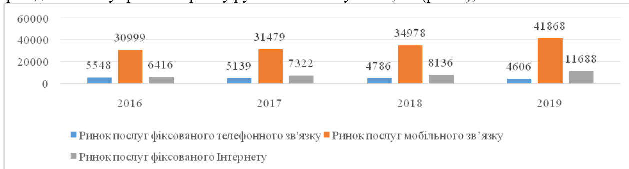
Рис. 2. Обсяг ринку телекомунікаційних послуг України за період 2016–2019 рр. у розрізі секторів, млн грн без ПДВ ( складено авторами на підставі [10, с. 9, 8, 11])

2) зменшення обсягів ринку фіксованого телефонного зв'язку у 2016–2019 рр. на 3,7% при одночасному зростанні ринку рухомого зв'язку на 12,7% (рис. 2);