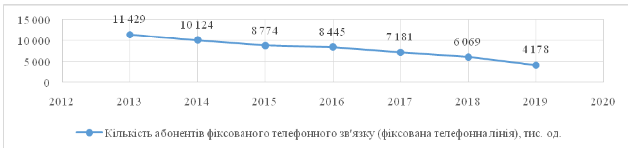
Рис. 3. Кількість абонентів фіксованого телефонного зв'язку (фіксована телефонна лінія) у 2013-2019 рр. (складено автором за даними Державної служби статистики України та [11])

За період 2017 – 2019 рр. спостерігалася тенденція щодо зменшення доходів від надання послуг фіксованого телефонного зв'язку, так у 2019 році зазначені доходи зменшились на 3,8 % у порівнянні із минулим роком. Станом на 31.12.2019 кількість ліній фіксованого телефонного зв'язку складала 4 178 тис. од., що на 31,2 %, або на 1 891 тис. од. менше ніж станом на 31.12.2018 (рис.3).