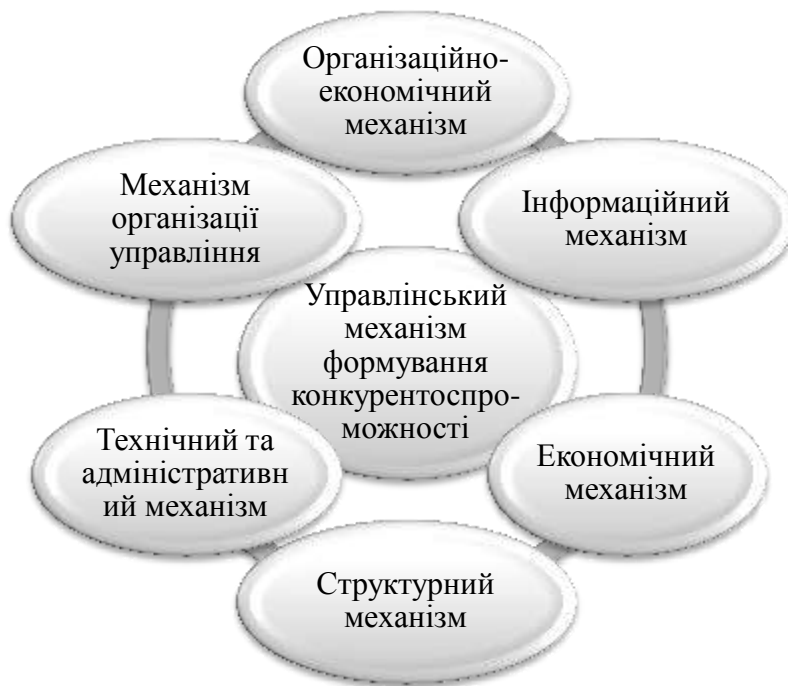
Рис. 1. Структура управлінського механізму забезпечення конкурентоспроможності підприємства

Оскільки природа внутрішніх факторів управління підприємством є різноманітною (організаційні, структурні, технічні, економічні, адміністративні, матеріальні фактори), слід виділяти певні види механізмів управління [4, с. 275]. Управлінський механізм підприємства являє собою сукупність організаційних, структурних, технічних, фінансовий, економічних та адміністративних важелів, які чинять вплив на загальногосподарські параметри системи управління підприємством, що, в свою чергу, сприяє формуванню та посиленню організаційно-економічного потенціалу, отриманню конкурентних переваг та ефективному функціонуванню підприємства в цілому. Основними структурними компонентами механізму управління із забезпечення конкурентоспроможності виступають: організаційні, економічні, структурні механізми, механізми організації управління, технічні і адміністративні, інформаційні механізми та інші, рис. 1.