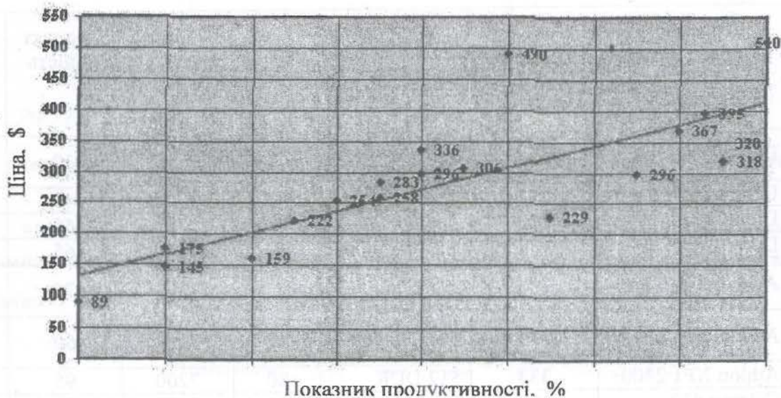
Рис. 3. Залежність між показниками ціни та продуктивності

Аналіз даних, наведених у табл.1, дає можливість зробити висновок про те, що одною з кращих (серед оцінюваних) конфігурацій системного блоку є варіант під № 19 – Р 4 - 2400. Показник його продуктивності P_{max} приймемо за 100% й відносно нього обчислимо значення показників продуктивності інших конфігурацій системних блоків АРМ з табл. 1. Отримавши їх, побудуємо графік залежності цих показників від відповідних ним значень ціни (рис. 3).