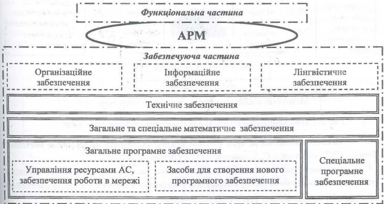
Рис.1. Типова структура АРМ

Їх структура та принципи функціонування такі, як: системність, гнучкість, стійкість, ефективність, ергономічність, максимальна орієнтація на кінцевого користувача, – вимагають розробки сукупності видів забезпечення: технічного, математичного, програмного, інформаційного, лінгвістичного, організаційного та інших (рис. 1).