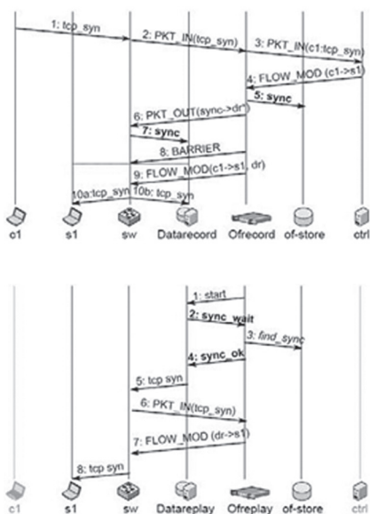
Рис. 3. Приклад використання Ofreplay, коли запит (5: TCP SYN) відправляється із системи зберігання Datareplay від c1

Запит TCP SYN, що відправляється від хоста c1 до S1 (рис. 3), може бути записаний за допомогою інструментарію Ofrecord (a) і знову прочитаний за допомогою інструментарію Ofreplay (б).